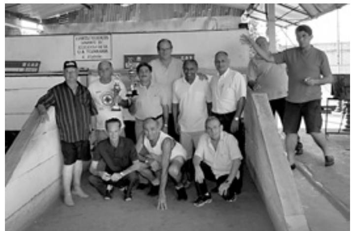
CTC Riopretano realiza torneios de bochas

É com imensa alegria que acolhemos as notícias do CTC Riopretano.