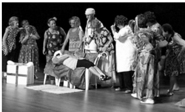
Grupo se apresenta para alunos de Universidade

Em agosto, o grupo de teatro da terceira idade do CTC-VP apresentou a peça “De médico e louco cada um tem um pouco”, na Universidade São Judas Tadeu. Esta peça é um dos trabalhos de maior sucesso do grupo e já foi apresentada em várias cidades.