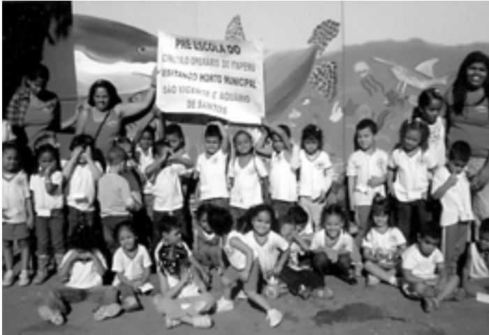
Escola do COI visita Horto Municipal e Aquário