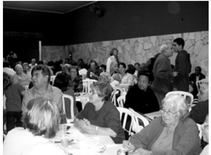
CTC de Vila Tibério - RP promove atividades sociais em seu belíssimo salão de festas